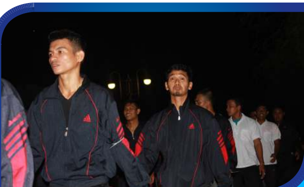
Dosen dan Mahasiswa STKIP BBG sedang mengikuti Lomba