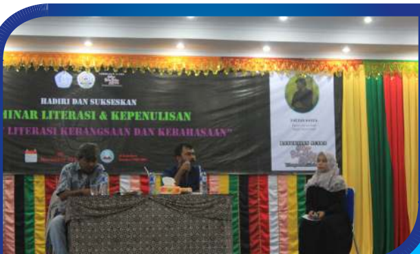
Redaktur Budaya Serambi Indonesia dan Pegiat Teater Aceh Pemateri Seminar Literasi PBSID STKIP BGG