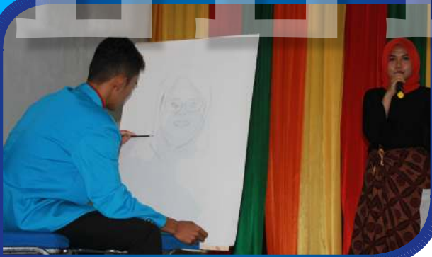
Penampilan Baca Puisi dan Melukis Pada Silaturahmi Mahasiswa PGSD