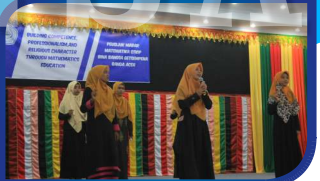
Penampilan Nasyid Mahasiswa Pendidikan Matematika STKIP BGG