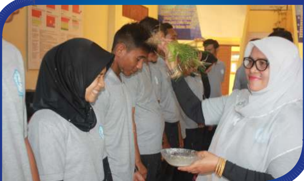
Peusijek dan Pelepasan Atlet Selekda Bapomi STKIP BGG 2017