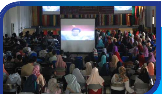
Nonton Bareng Film G 30 S PKI di Aula STKIP BBG