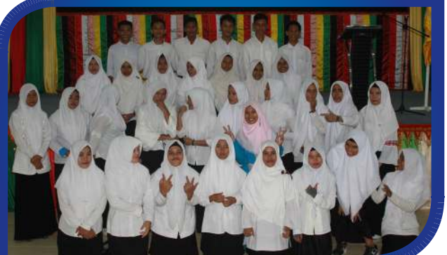
Ketua Prodi Pendidikan Bahasa Inggris STKIP BBG berpose bersama mahasiswa baru