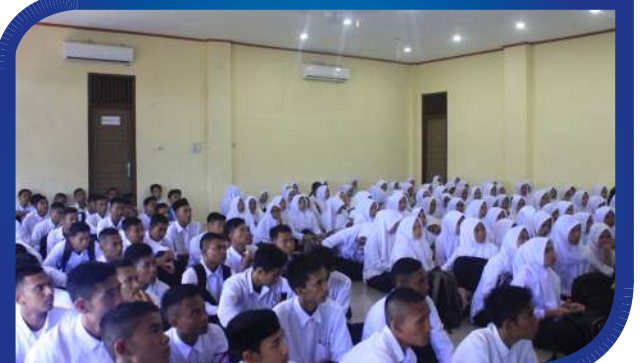
Peusijek dan Temu Ramah Mahasiswa Baru STKIP BGG 2017