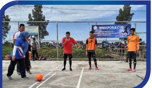
Ketua STKIP BBG Buka Himapora Cup 2017