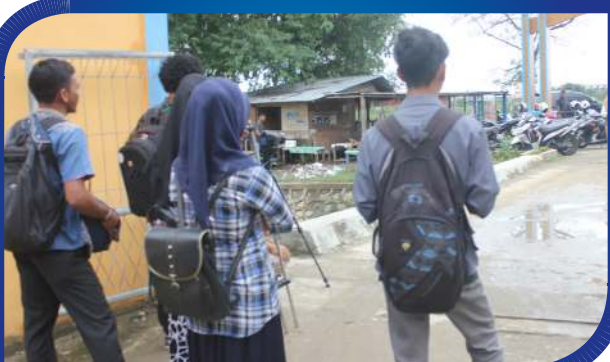
Proses Syuting Film Titah Ibu Garapan Mahasiswa dan Dosen STKIP BGG