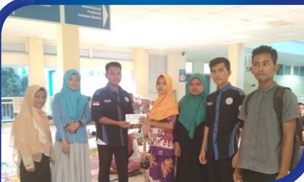
BEM STKIP BBG Bantu Korban Atresia Biller