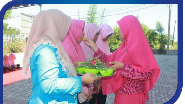
Prosesi Peusijek Mahasiswa PAUD STKIP BGG