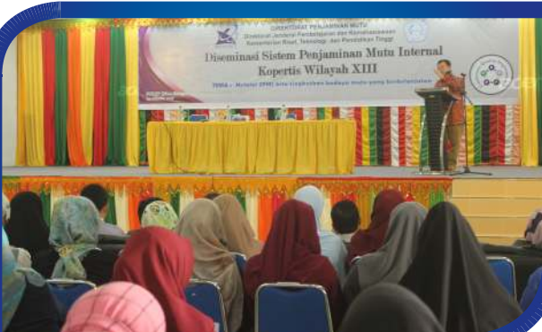
Diseminasi Sistem Penjaminan Mutu Internal Kopertis XIII Berlangsung di Aula STKIP BBG