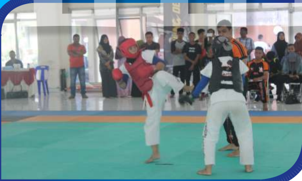
Atlet STKIP BBG (Rompri Merah) Sedang Bertanding pada Selekda Babomi 2017