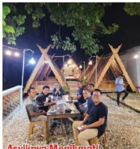
SEBUAH kafe bernama Sinanggal baru beroperasi di Gunung Lagan, Aceh Singkil. Kafe ini mengandikan sentuhan etnik dan menjual aneka kuliner khas Singkil. Menikmati malam sampai ngopi di kafe ini sungguh asyik. Foto: Irtinan Wanhir Lingga, Gunung Lagan, Aceh Singkil.