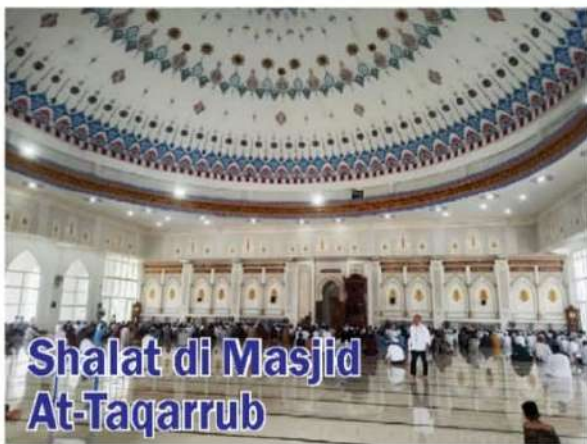
SUAUSA sebagai shalat Juma di Masjid At-Taqarrub, Kecamatan Trienggading, Pidie Jaya (Pjaya). Masjid ini merupakan masjid terbesar di Pidie Jaya yang dibangun pemerintah plaacempa menguancang kabupaten itu tahun 2016.