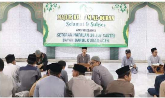
Santri Darul Quran Aceh (DQA) sedang khatam menghafal ayat-ayat Al-Quran 30 Juz di Masjid Al Mansor, komplek Dayah DQA, gampong Timbo Baro, Kec. Kuta Malaka, Kabupaten Aceh Besar.