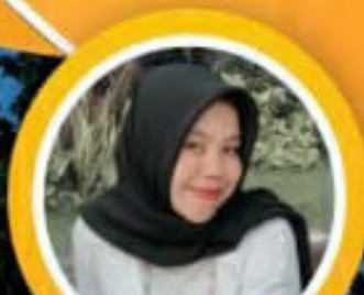
Sismita Rezeki Juara II Lomba Cipta Puisi Tingkat Nasional