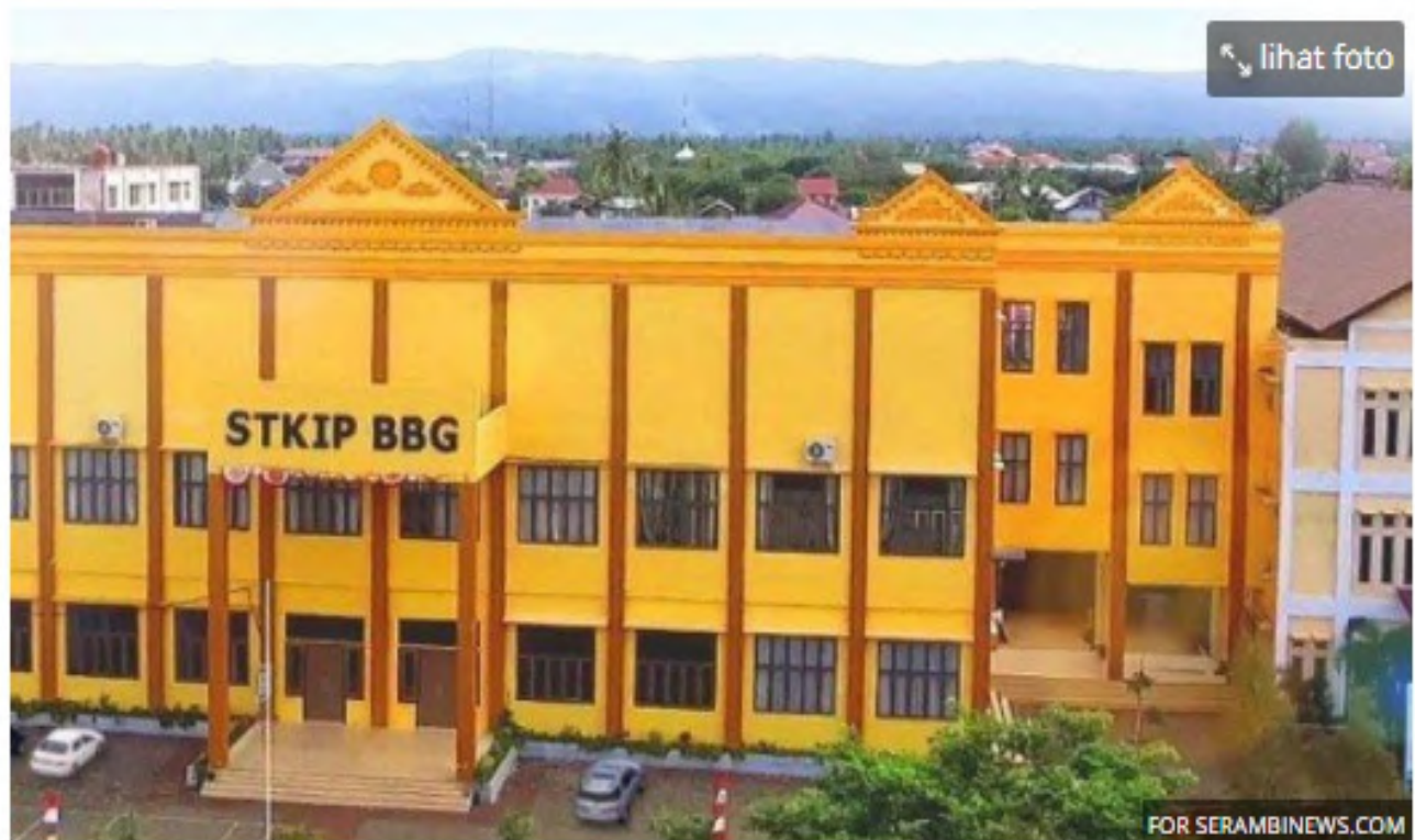
Kampus Universitas Bina Bangsa Getsempena (BBG) Banda Aceh

Penulis: Muhammad Nasir | Editor: Saifullah