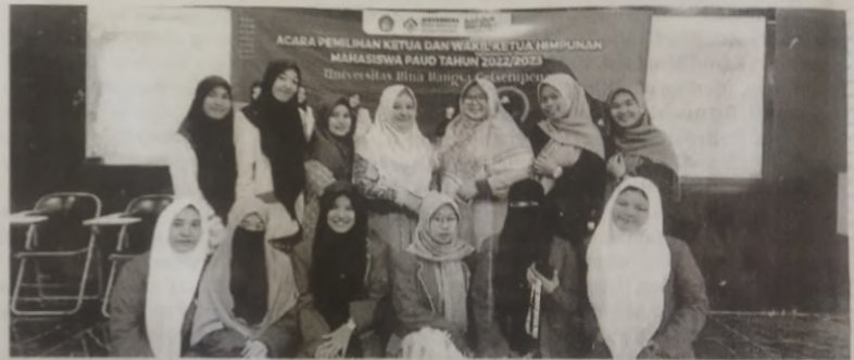
Prodi PG PAUD Universitas BBG Banda Aceh adakan kegiatan pemilihan ketua dan wakil ketua Himpunan Mahasiswa PAUD (HIMAPA) di Aula Mini kampus setempat, Selasa, (07/06/22).

ua Prodi PG PAUD dalam sambutannya mengungkapkan, organisasi bisa berhasil dengan adanya kerjasama antar ketua, wakil dan seluruh anggota. Semoga, para kandidat terpilih nantinya mampu menjalankan visi misinya dengan baik. "Pesan saya ke-