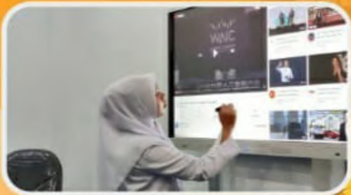
LAB Microteaching yang lengkap